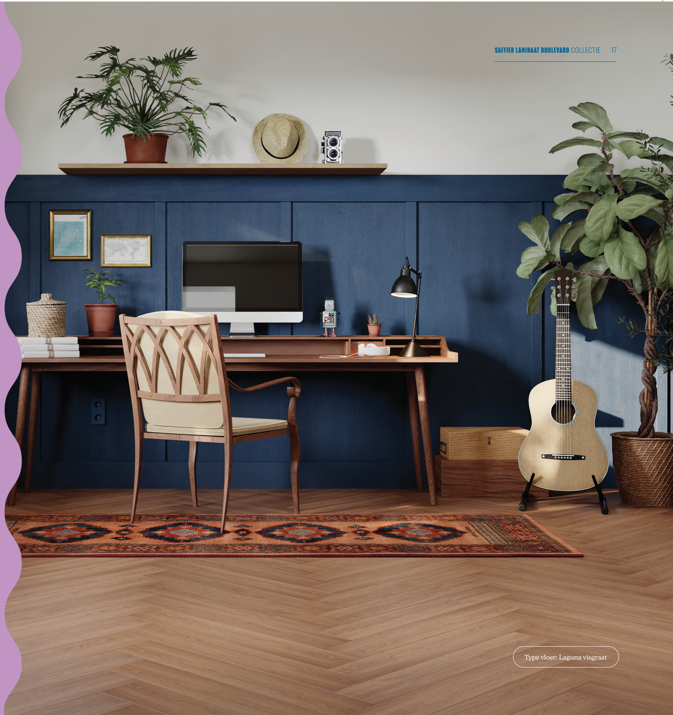
Type vloer: Laguna visgraat